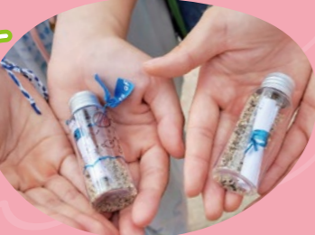
メッセージカードを交換し、 ボトルメール風の思い出の クラフトを作成