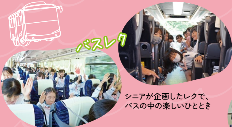
シニアが企画したレクで、バスの中の楽しいひととき