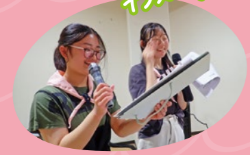
クイズを通して若狭湾について知識を深めました。 施設で働くガールスカウトの仲間が特別ゲストで登場!