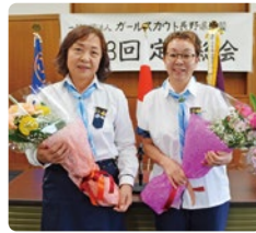
トレーナー2人が任期終了により退任しました。